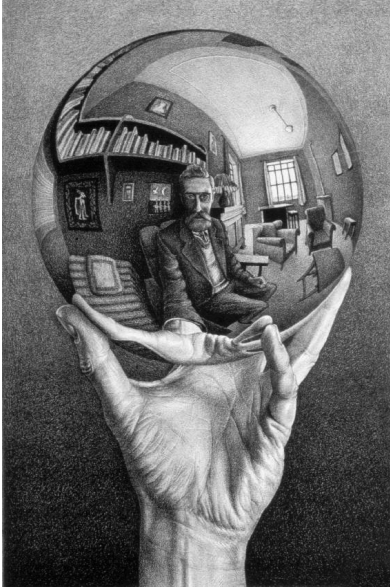
Özeleştirisi, kendine, yapıtına dışarıdan bakabilmektir. M.C. Escher, litograf, 1935

ciddi katkılarından birini, eleştiri alanında içkin eleştiri kavramıyla yapmıştır. 'Eleştirel Teori', 'düşünceler' ile 'gerçek' arasındaki açıklığı ölçme çabasıdır. Kullandığı yöntem de içkin (=İmmanent) eleştiridir. İçkin eleştiri demek; "Varolan (ortaya konulmuş bulunan yapıt)ın karşısına, o yapıtın yazarının kendi kavramsal ilkelerinin iddialarıyla çıkmak, böylece ikisi arasındaki ilişkiyi (ya da çelişkiyi) eleştirmek ve aşmak" demektir. (s. 47, 48) - "Bir olguyu, kendi ilkesiyle eleştirmek"tir bu... (ya da birini kendi kullandığı silahla vurmak). K. Marks'ın "Ekonomi Politikin Eleştirisi" kitabında kullandığı yöntem de bu içkin eleştiriden başkası değildir." (s. 48)